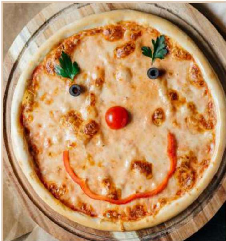
ПИЦЦА «ЧИПОЛЛИНО» (340 гр)