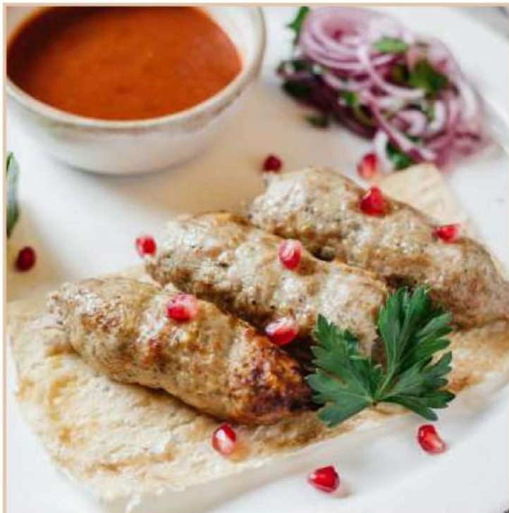
ЛЮЛЯ-КЕБАБ ИЗ БАРАНИНЫ