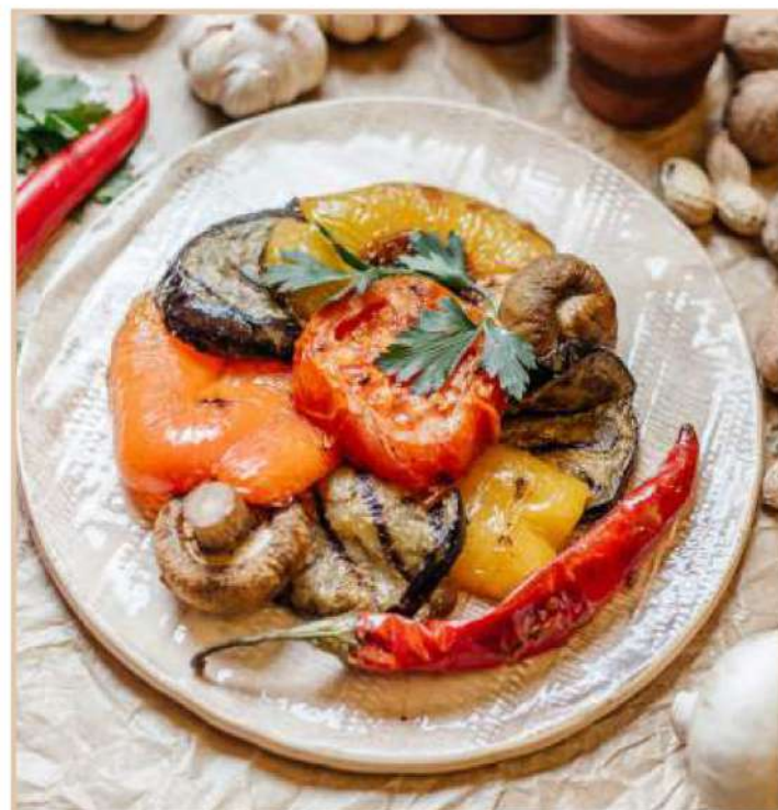
ОВОЩИ ГРИЛЬ (150 гр)