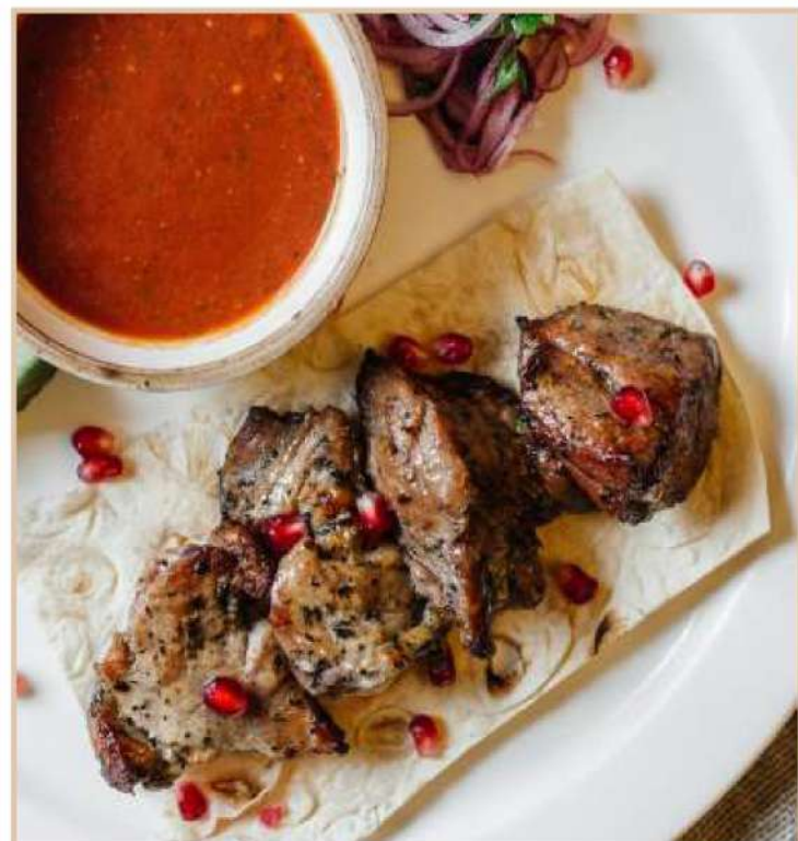
ШАШЛЫК ИЗ СВИНИНЫ