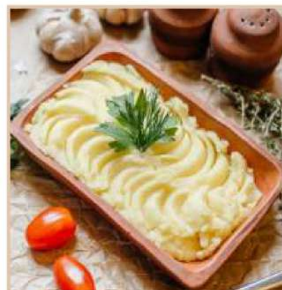
ПЮРЕ (150 гр)