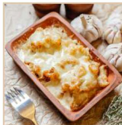
ЦВЕТНАЯ КАПУСТА, ЗАПЕЧЕННАЯ С СЫРОМ (150 гр)