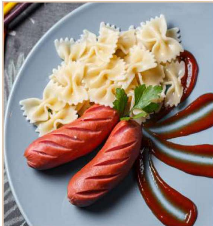
МАКАРОНЫ С СОСИСОЧКАМИ (200 гр)