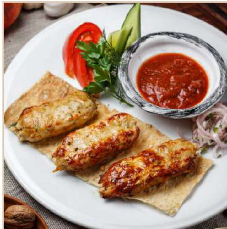
ЛЮЛЯ-КЕБАБ ИЗ КУРИЦЫ