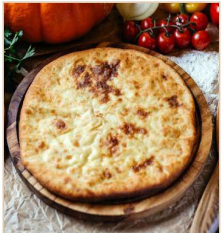
ОСЕТИНСКИЙ ПИРОГ С ТЫКВОЙ И СЫРОМ