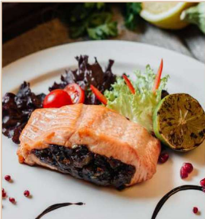
ЛОСОСЬ, ЗАПЕЧЕННЫЙ С БАКЛАЖАНАМИ