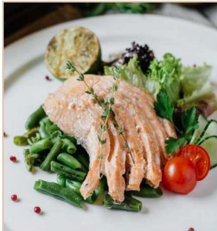
СЕМГА НА ПАРУ С ЗЕЛЕННОЙ ФАСОЛЬЮ