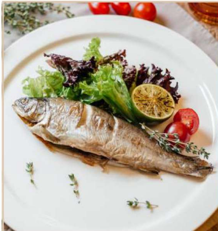
РЕЧНАЯ ФОРЕЛЬ, ЗАПЕЧЕННАЯ С ТРАВЫМИ И ЛИМОНОМ