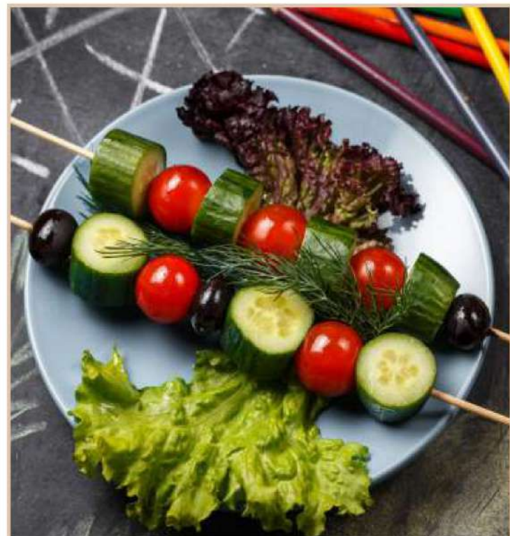
ОВОЩНОЙ ШАШЛЫЧОК (250 гр)