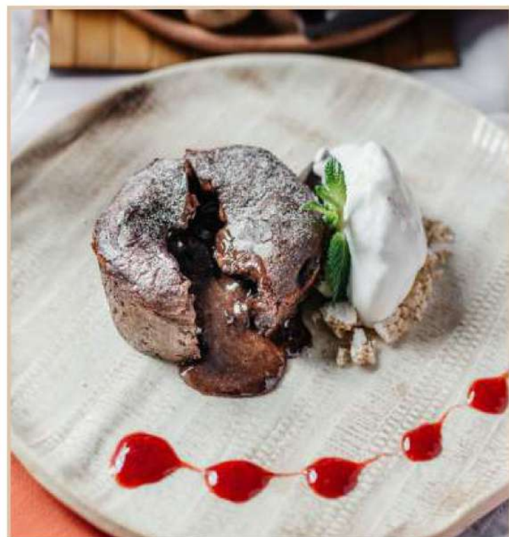
ШОКОЛАДНЫЙ ФЛАН С МОРОЖЕННЫМ

Этот десерт для настоящих фанатов шоколада (150 гр)