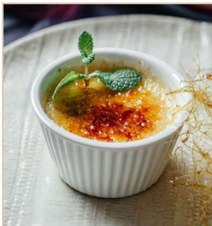
ФРАНЦУЗСКИЙ ДЕСЕРТ «КРЕМ БРЮЛЕ»