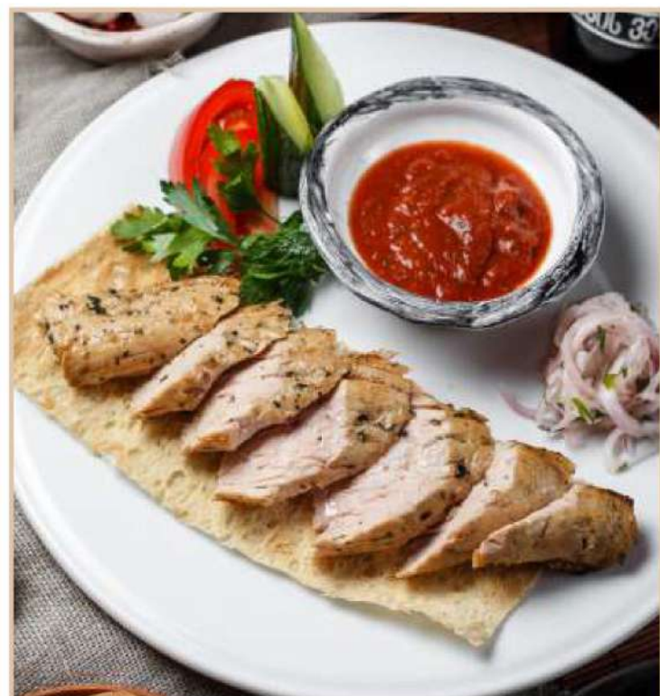
ШАШЛЫК ИЗ СВИНОЙ ВЫРЕЗКИ