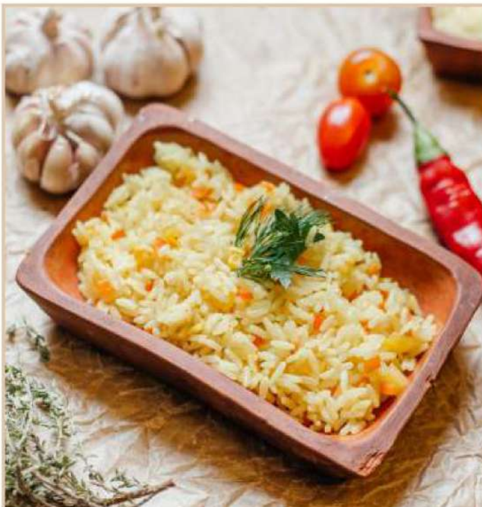
РИС С ОВОЩАМИ (150 гр)