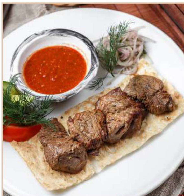
ШАШЛЫК ИЗ БАРАНИНЫ