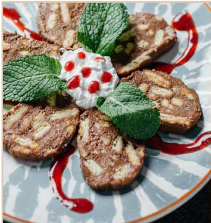
ШОКОЛАДНАЯ КОЛБАСА «КАК В ДЕТСТВЕ»