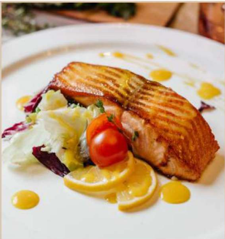
СТЕЙК ИЗ ЛОСОСЯ ПОД АПЕЛЬСИНОВЫМ СОУСОМ