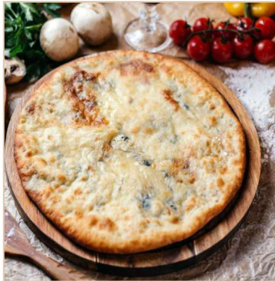
ОСЕТИНСКИЙ ПИРОГ С СЫРОМ И ГРИБАМИ