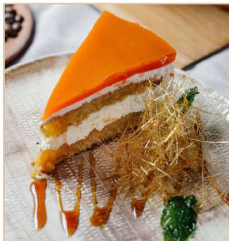
ТОРТ «ИТАЛЬЯНСКОЕ ЛЕТО»

Морковный торт с нежным сливочным кремом и морковной глазурью (185 гр)