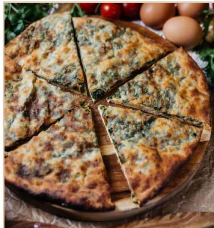
ОСЕТИНСКИЙ ПИРОГ СО ШПИНАТОМ И ЗЕЛЕНЬЮ