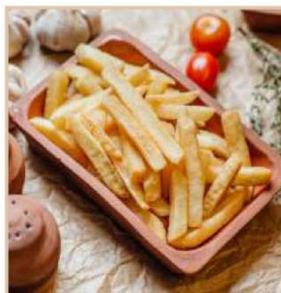
КАРТОФЕЛЬ ФРИ (150 гр)