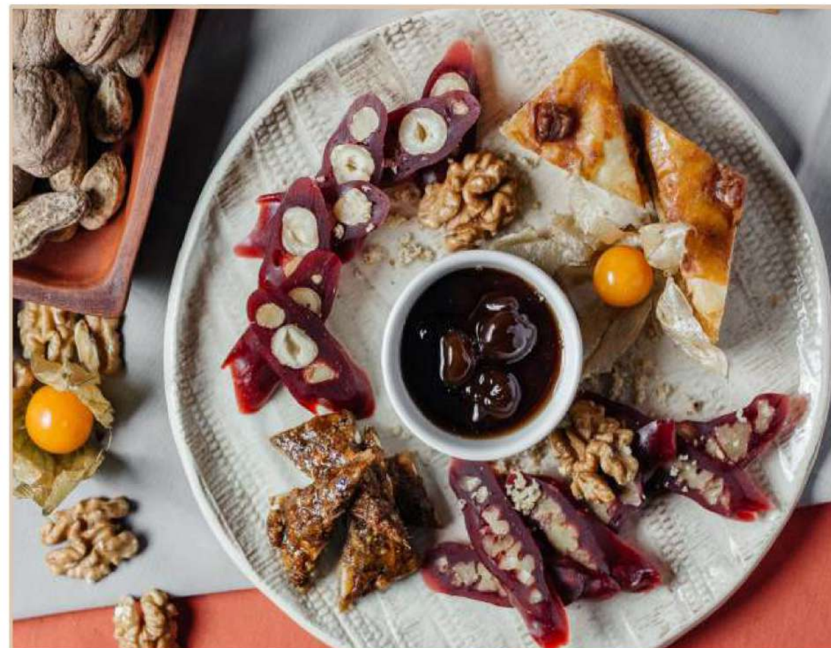
АССОРТИ ГРУЗИНСКИХ СЛАДОСТЕЙ

Пахлава, гозиники из грецких орехов, чурчхела из фундука и грецкого ореха, варенье (200 гр)