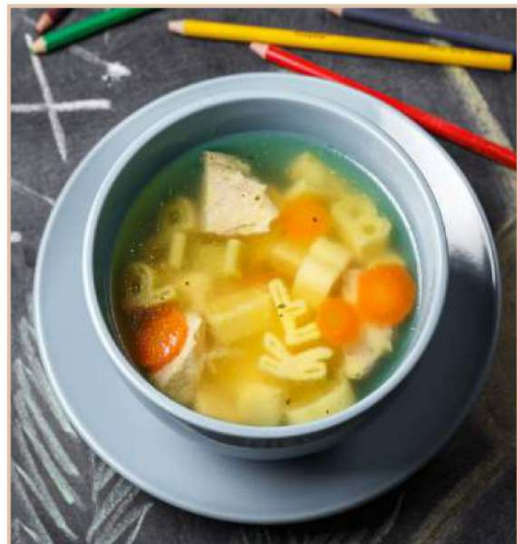
КУРИНЫЙ БУКВОСУП (200 гр)