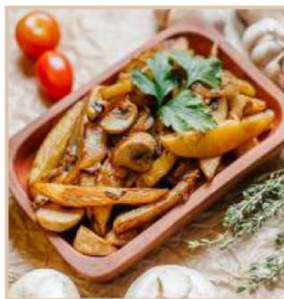
КАРТОФЕЛЬ, ЖАРЕННЫЙ С ГРИБАМИ ПО-ДОМАШНЕМУ (150 гр)