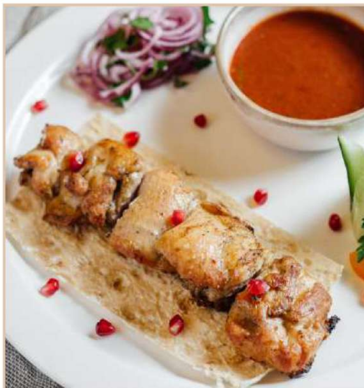
ШАШЛЫК ИЗ КУРИЦЫ