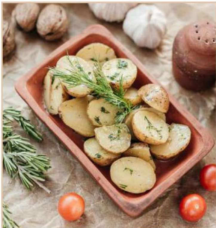
МОЛОДОЙ КАРТОФЕЛЬ ПО-ДЕРЕВЕНСКИ